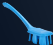
Brosse à main UST, manche long, Dur Référence : 4196x