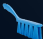
Balayette UST, Medium Référence : 4585x