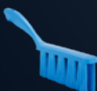
UST Balayette, Souple Référence : 4581x